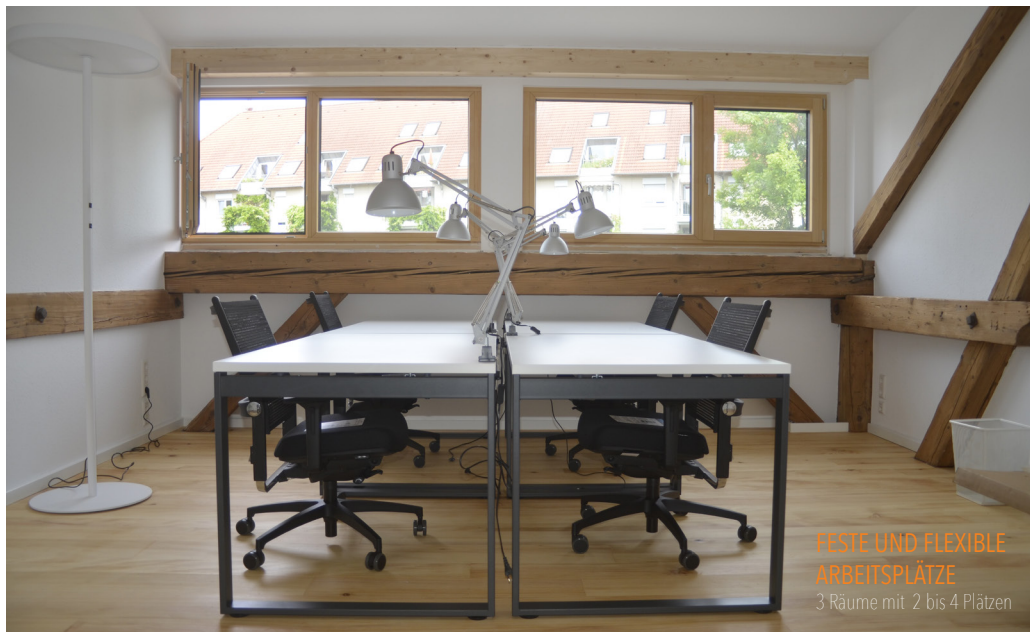
FESTE UND FLEXIBLE ARBEITSPLÄTZE 3 Räume mit 2 bis 4 Plätzen