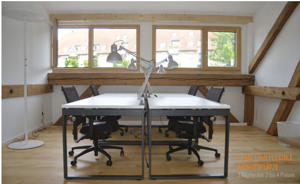
FESTE UND FLEXIBLE ARBEITSPLÄTZE 3 Räume mit 2 bis 4 Plätzen